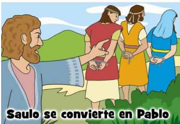
Saulo se convierte en Pablo

Hechos 9:3-5. Mas yendo por el camino, aconteció que al llegar cerca de Damasco, repentinamente le rodeó un resplandor de luz del cielo; y cayendo en tierra, oyó una voz que le decía: Saulo, Saulo, ¿por qué me persigues? El dijo: ¿Quién eres, Señor? Y le dijo: Yo soy Jesús, a quien tú persigues; dura cosa te es dar coces contra el aguijón.