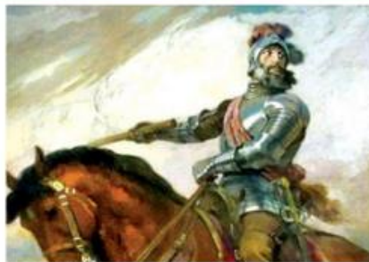
Francisco Pizarro, Perú

Cortez arribo a México en 1519. Se encuentra con el imperio azteca, el cual contaba con una gran cantidad de población, desarrollo tecnológico y comercial. Luego de dos años de luchas intensas contra el imperio azteca, estos son vencidos.