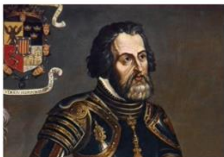
Hernán Cortez, México

Como ya hemos visto a la llegada de los europeos al continente, existían grandes imperios, existen muchas razones para explicar esta situación. Destacan los casos de Hernán Cortez con los aztecas y Francisco Pizarro con los Incas.